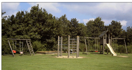
Der Kinderspielplatz auf dem TuS-Sportgelände am Wendohweg